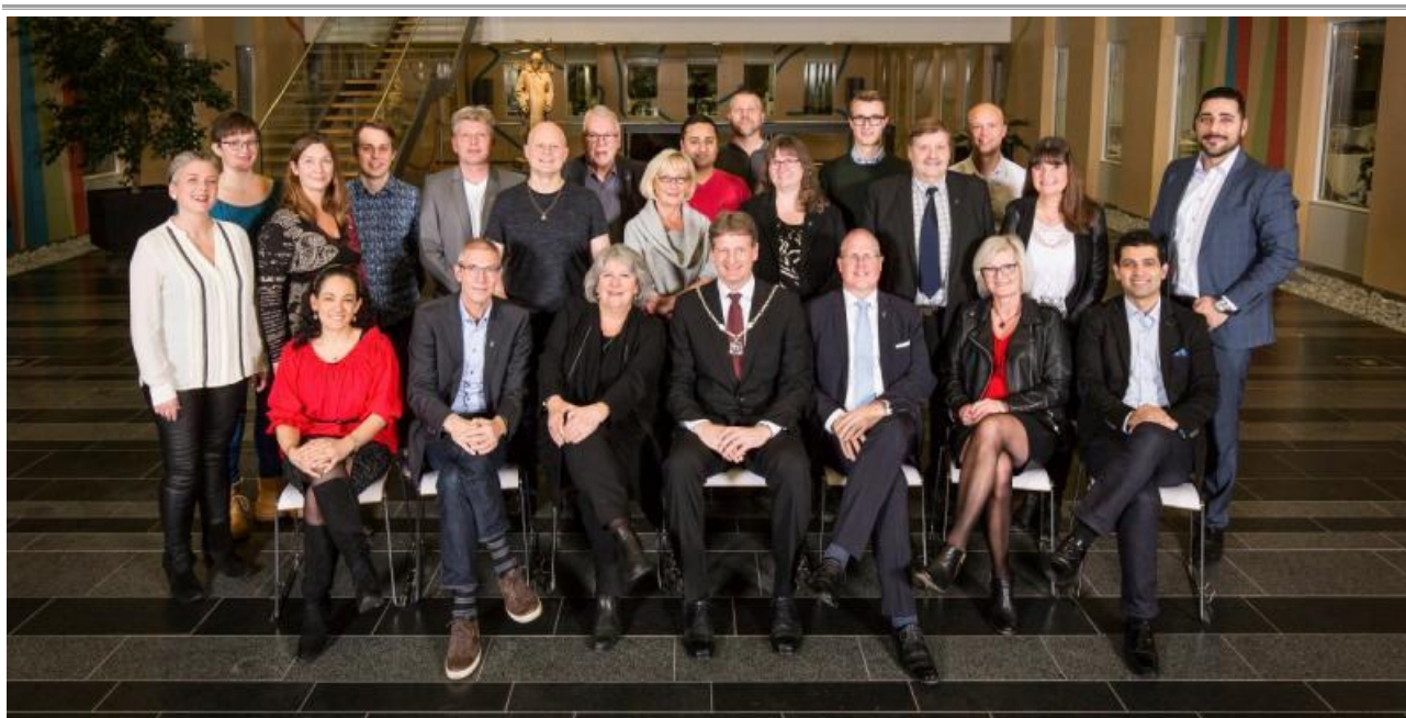
Foto: Efter det konstituerende møde blev det obligatoriske "politiker-holdfoto" taget