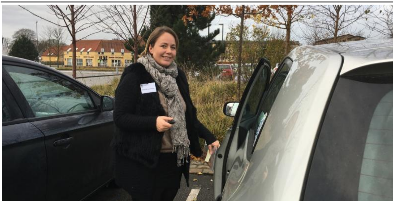
Foto: Som noget nyt har dagens "runners" navneskilte på, når de kører ud til valgstederne. Så er det nemmere at se på valgstedet, at det er en medarbejder fra Ballerup Kommune og ikke en vælger.