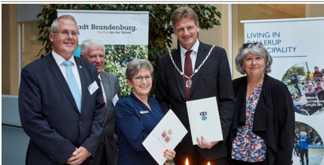
Foto: Torsdag eftermiddag blev der sat underskrifter på samarbejdsaftalen mellem Brandenburg an Der Havel og Ballerup Kommune