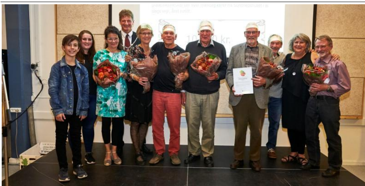
Foto: Holdfoto af de glade vindere fra Sundhedsplejen og Cykelcaféen sammen med borgmester Jesper Würtzen og formand for Social- og sundhedsudvalget Lolan Ottesen.